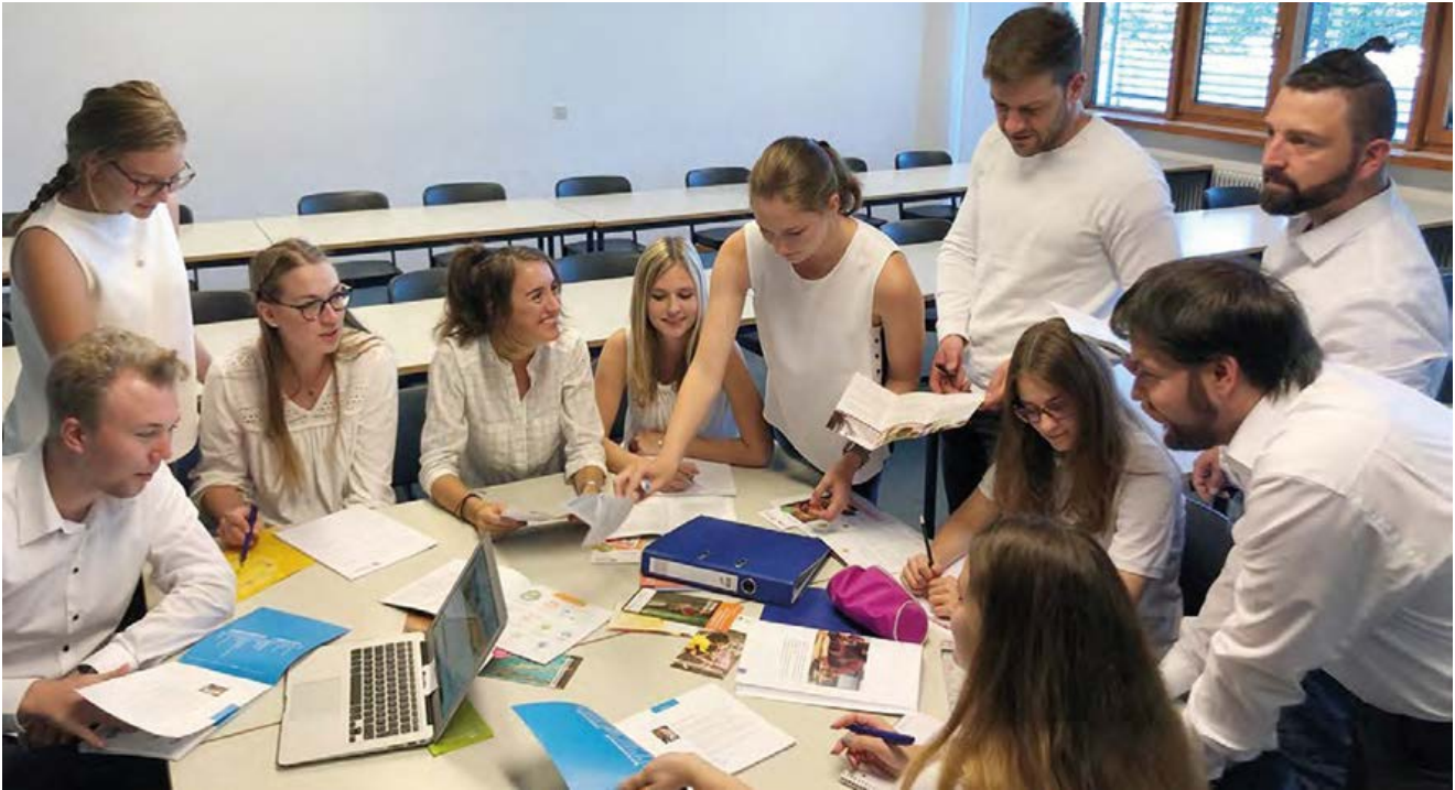
Studierende des Landratsamts München Qualifikationsebene 3 des nichttechnischen Verwaltungsdienstes Jahrgang 2017/2020

Überarbeitet wurde diese 2. Auflage von Studierenden des Studiengangs Public Managements von der Hochschule Kehl, die im Frühjahr 2023 ein Praktikum im Landratsamt München absolvierten.